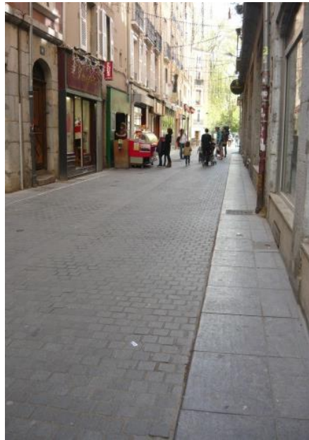
Un exemple en référence, La rue Diodore Raoult

← Projet rue Chenoise : poursuivre les bandes calcaires déjà existantes sur une petite partie de la rue (ici devant la maison Vaucanson XVIe, un des 4 immeubles classés "Monument historique" de la rue)