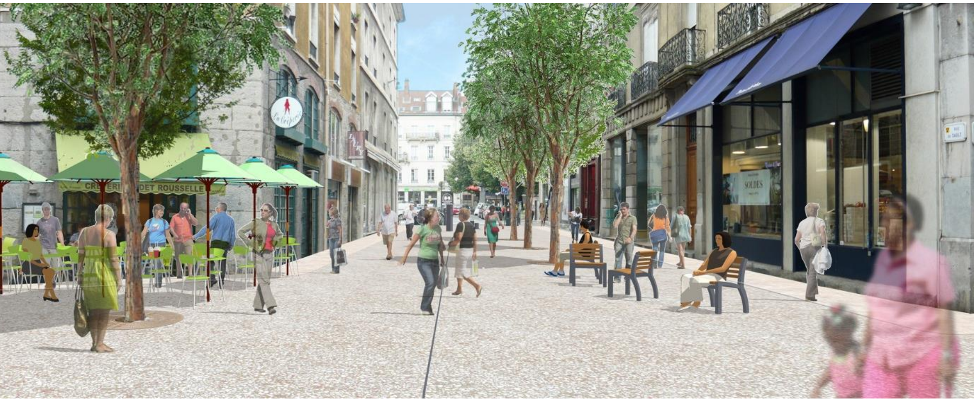
Rue de Sault